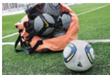
Забей с пенальти!